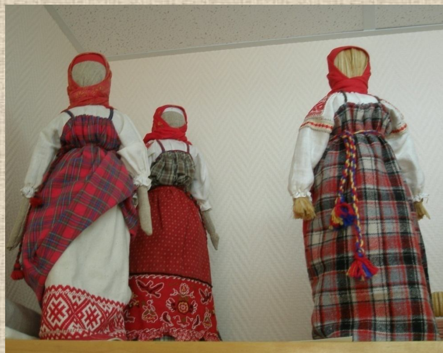
Куклы из Дома творчества Бурчевского